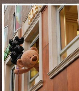
ถนนอันฟู่