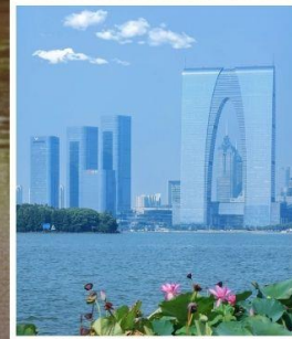
SUZHOU EAST GATE