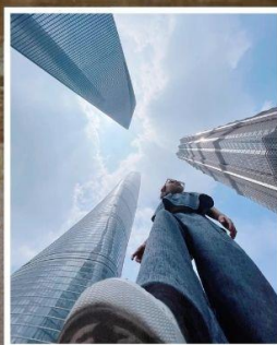
3 ตึกใหญ่ แห่งเมืองไฮ้