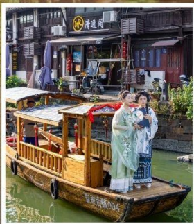
เมืองโบราณจีนชื่อ