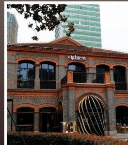
ย่านเฟิงเซินหลี่