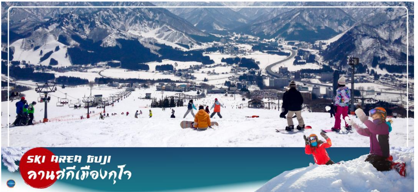
SKI AREA GUJO ลานสกีเมืองกุโจ

วันที่สาม เมืองกุโจซาจิมัง – ลานสกีเมืองกุโจ – เมืองกิฟู – หมู่บ้านมรดกโลกชิราคาวาโกะ – เมืองทาคายามะ – ถนนชั้นมาจิซุจิ – เมืองนาโกย่า