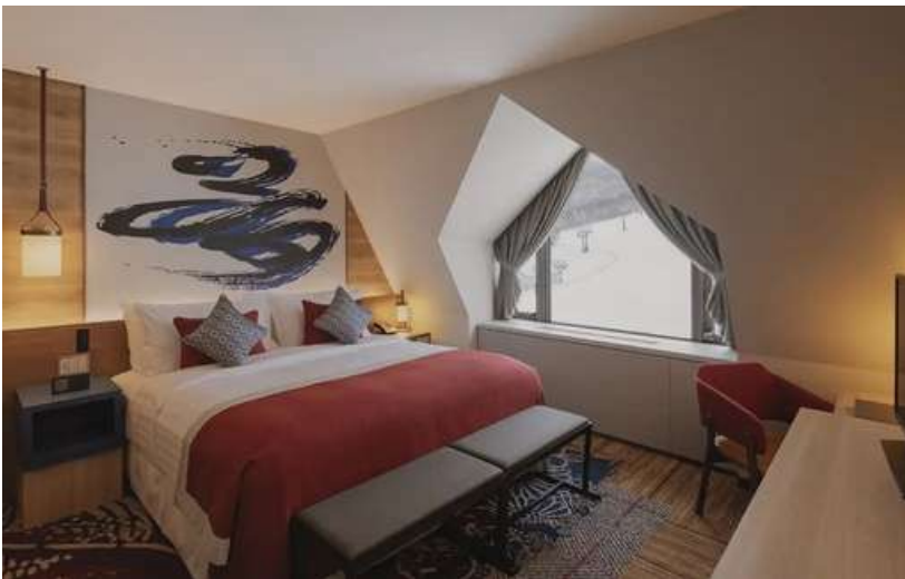
Superior Room: 2 Adults

Bathrooms have a bathtub/shower combination ensuring you can relax and soak in the tub after an active day on the mountain.