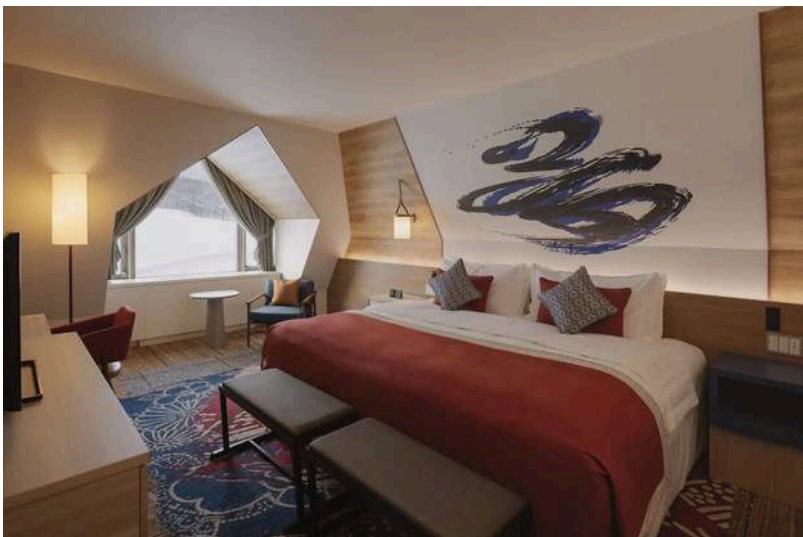
Junior Family Suite: 2 Adults + 3 Teenagers