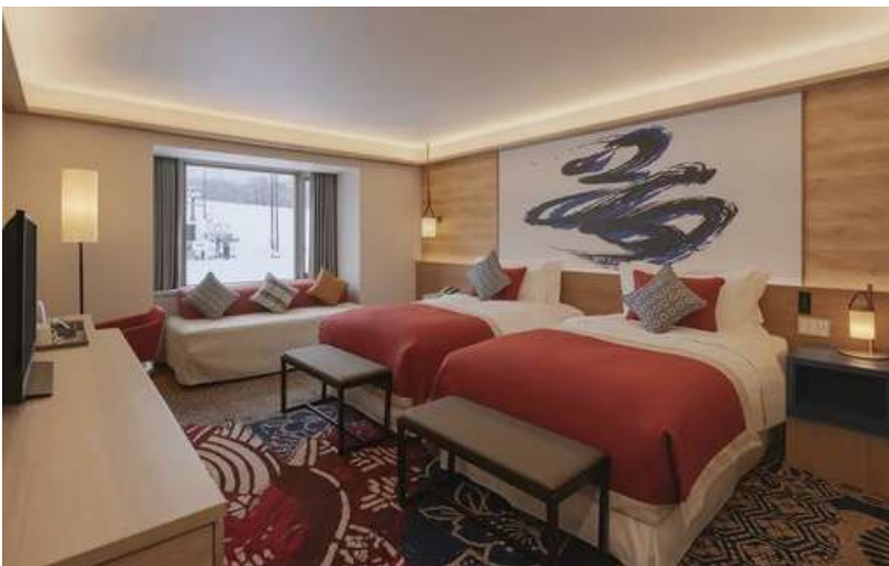
Junior Family Superior Room: 2 Adults + 1 Teen