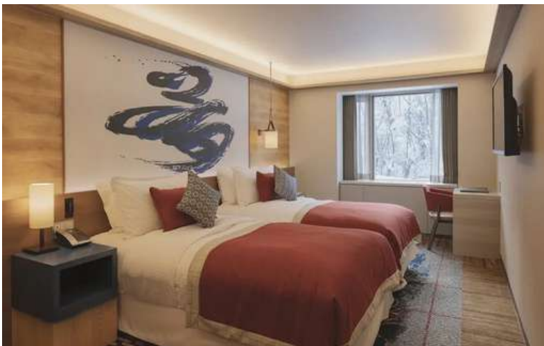
Junior Family Deluxe Room: 2 Adults + 1 Teen