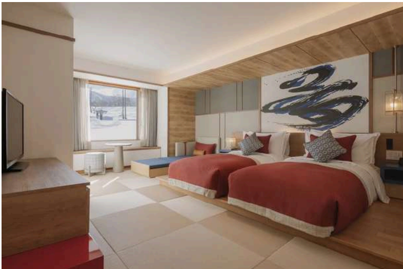
Junior Family Superior Room – Tatami: 2 Adults + 1 Teen

Bathrooms have a bathtub/shower combination ensuring you can relax and soak in the tub after an active day on the mountain.