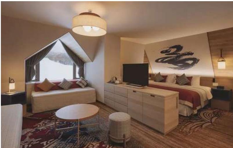
Family Deluxe Room: 2 Adults + 2 Teenagers

Bathrooms have a bathtub/shower combination ensuring you can relax and soak in the tub after an active day on the mountain.