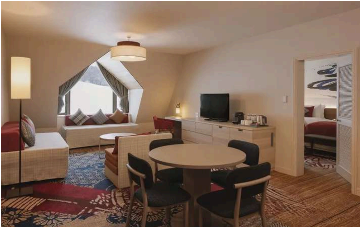
Family Suite: 2 Adults + 3 Teenagers

Bathrooms have a bathtub/shower combination ensuring you can relax and soak in the tub after an active day on the mountain.