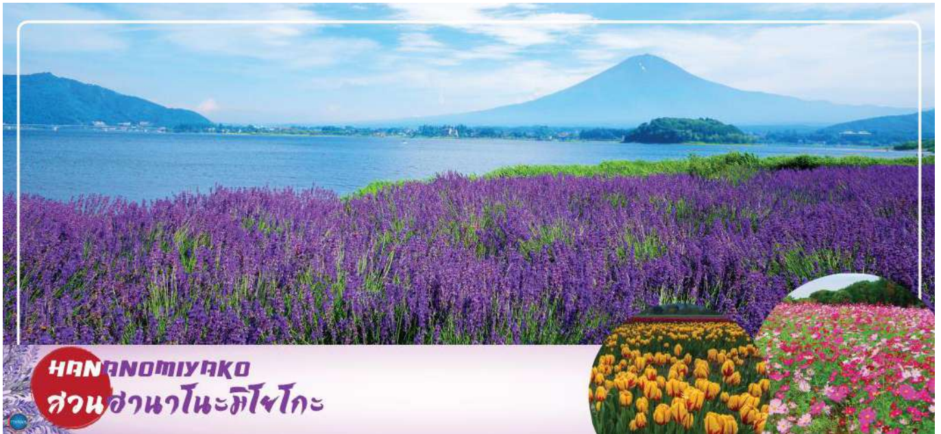
HANANOMIYAKO สวนฮานาโนะมิยาโกะ

วันที่สาม เมืองยามานาชิ – สวนดอกไม้सानะโนะมียาโกะ หรือ เทศกาลชมดอกกลาเวนเดอร์ที่ทะเลสาบคาวากุจิ (ตามฤดูกาล) – พิธีซงชาญี่ปุ่น – กรุงโตเกียว – ย่านโอไดบะ – ห้างไดเวอร์ซิตี – เมืองนาริตะ – อีออนมอลล์ นาริตะ