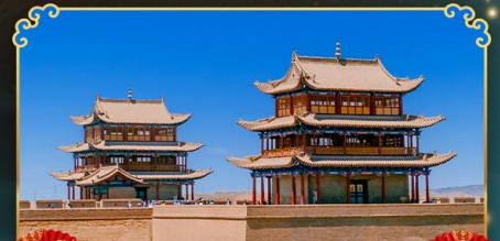
กำแพงเมืองจีนเจียวอ้วกวน