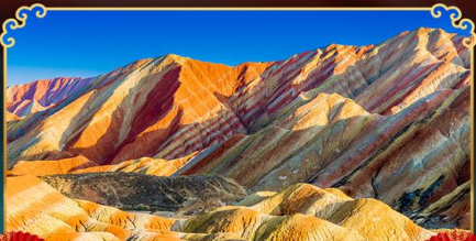
ภูเขาสายรุ้งจางเย่

เดินทางตามรอยเส้นทางสายประวัติศาสตร์โลก ชมโอเอซิสกลางทะเลทราย "ทะเลสาบพระจันทร์เสี้ยว"