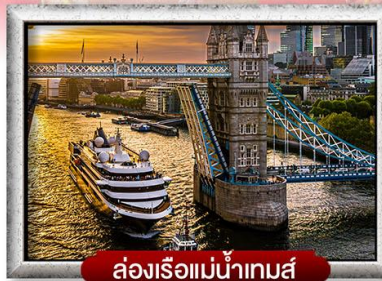
ล่องเรือแม่น้ำเทมส์