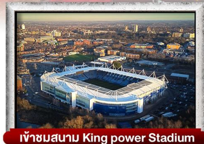
เข้าชมสนาม King power Stadium

พิเศษ!! เมนู เบอร์เกอร์ต้นตำรับ & กุ้งล็อบสเตอร์ และ เปิดย่างไฟร์ชิลีน