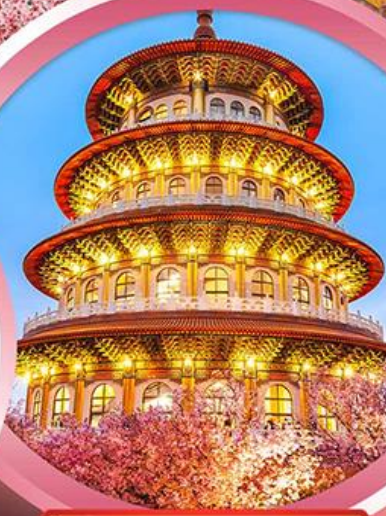
วัดจู้เทียนหยวน

ช้อปปิ้งจุใจ ย่านซีเหมินติง ตลาดไทจงไนท์มาร์เก็ต อิมอร้อยกับ..เมนูปลาประดานาฮิบตี ชาบูบุฟเฟ่ต์สไตล์ไต้หวัน เสียวหลงเปา