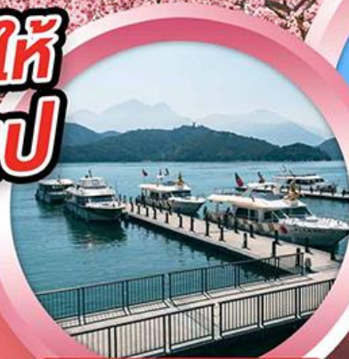
ล่องเรือทะเลสาบสุรียันจินทรา