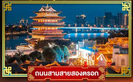
ถนนสามสายสองนคร