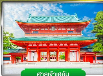
ศาลเจ้าเฮอัน