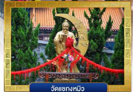
วัดเซกหมิง