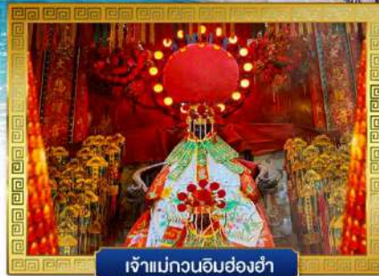
เจ้าแม่กวนอิมฮ่องฮ่า