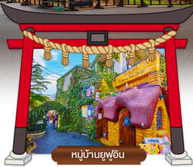
หมู่บ้านยูฟูอิน