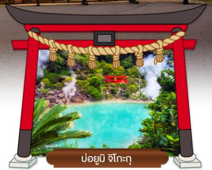
บ่อยูมิ จิโกะกุ