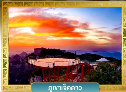
ภูเขาเจ็ดดาว