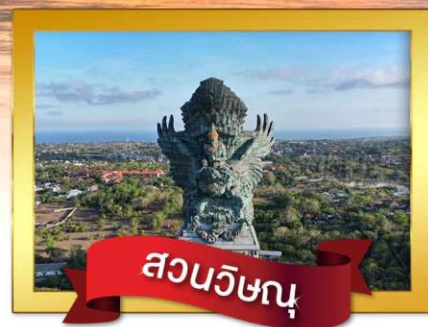
สวนวิชณุ