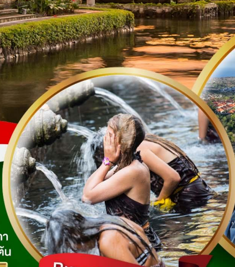
Pura Tirta Empul