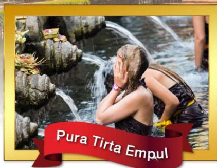
Pura Tirta Empul