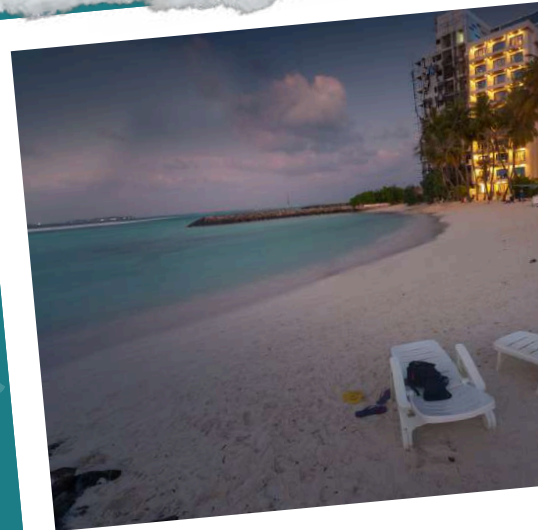
Kaani Palm Beach