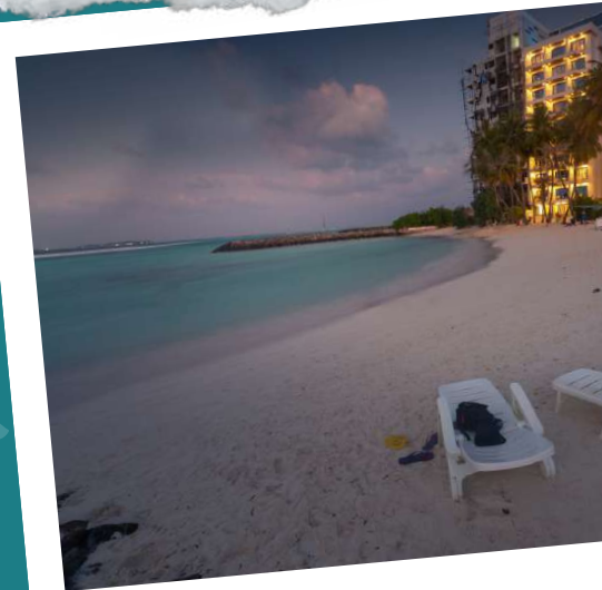
Kaani Palm Beach