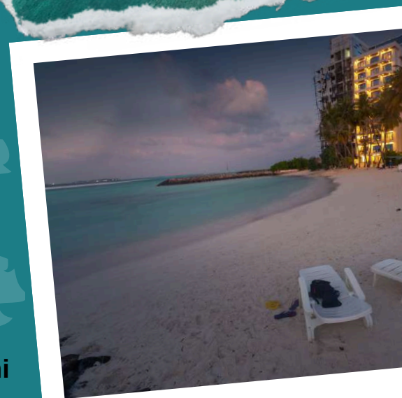
Kaani Palm Beach