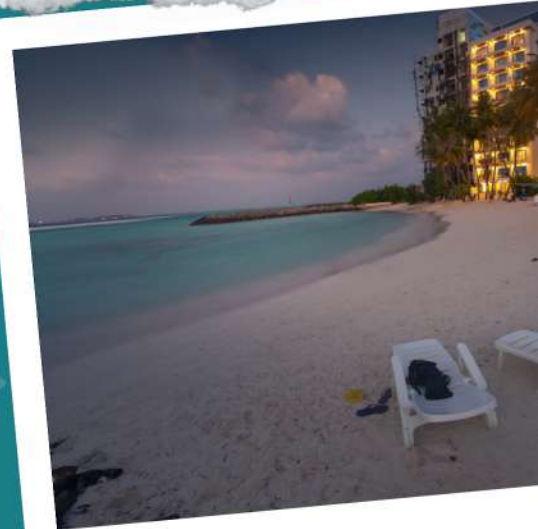
Kaani Palm Beach