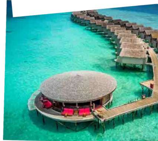
Centara Ras Fushi