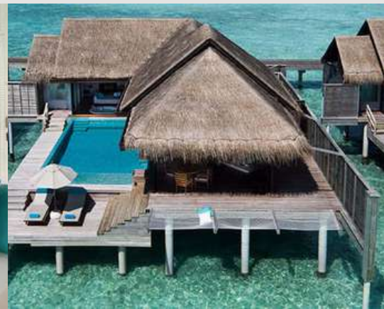
Sunset Over Water Pool Villa