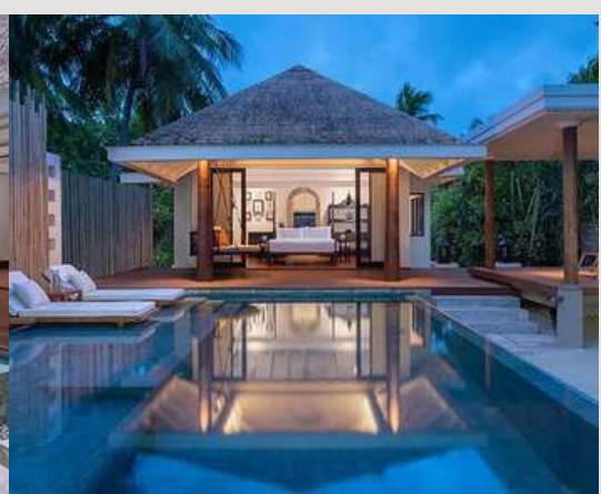
1 Bedroom Family Beach Pool Villa