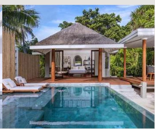
Sunset Beach Pool Villa