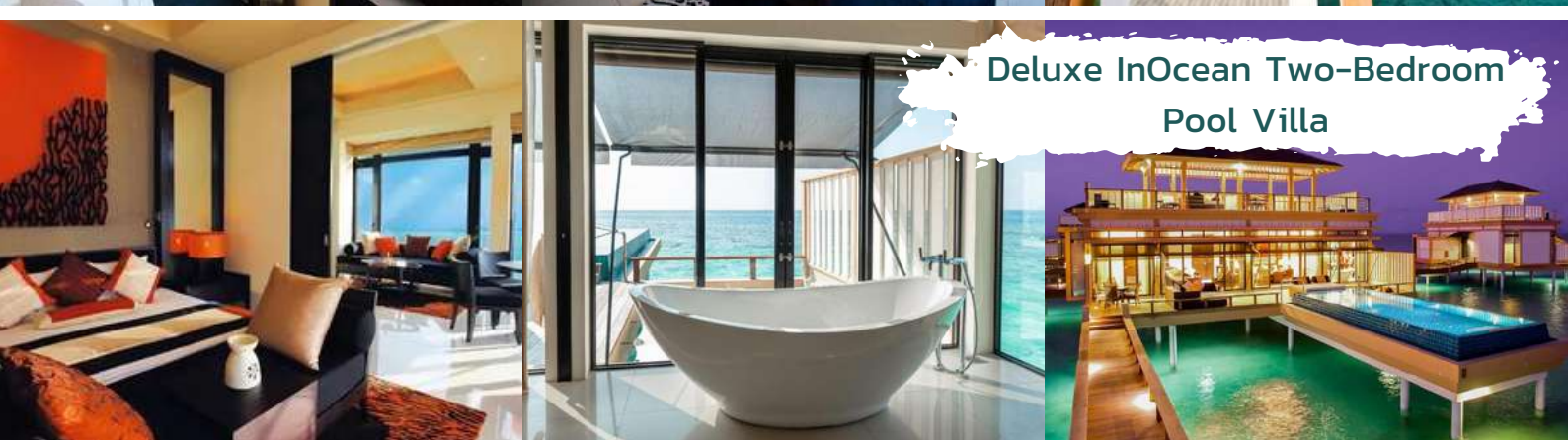
Deluxe InOcean Two-Bedroom Pool Villa