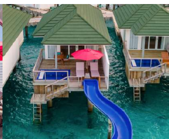
OCEAN VILLA WITH POOL + SLIDE