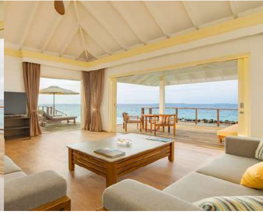
2 BEDROOM LAGOON VILLA WITH POOL + SLIDE