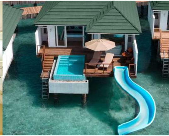
WATER VILLA WITH POOL + SLIDE