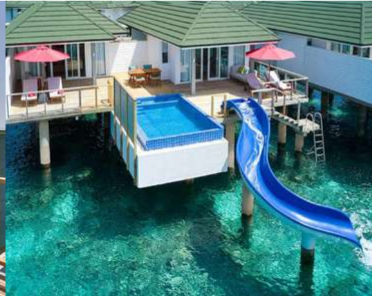
3 BEDROOM LAGOON VILLA WITH POOL + SLIDE