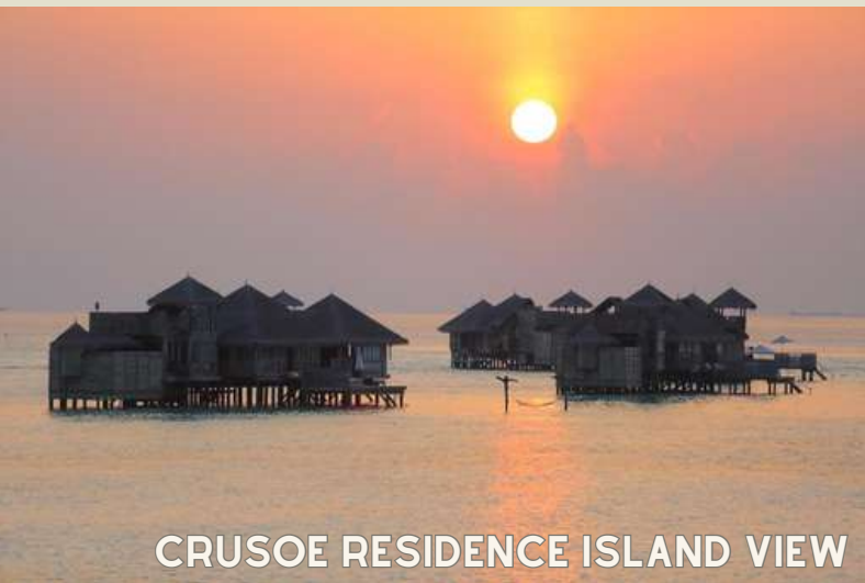
CRUSOE RESIDENCE ISLAND VIEW