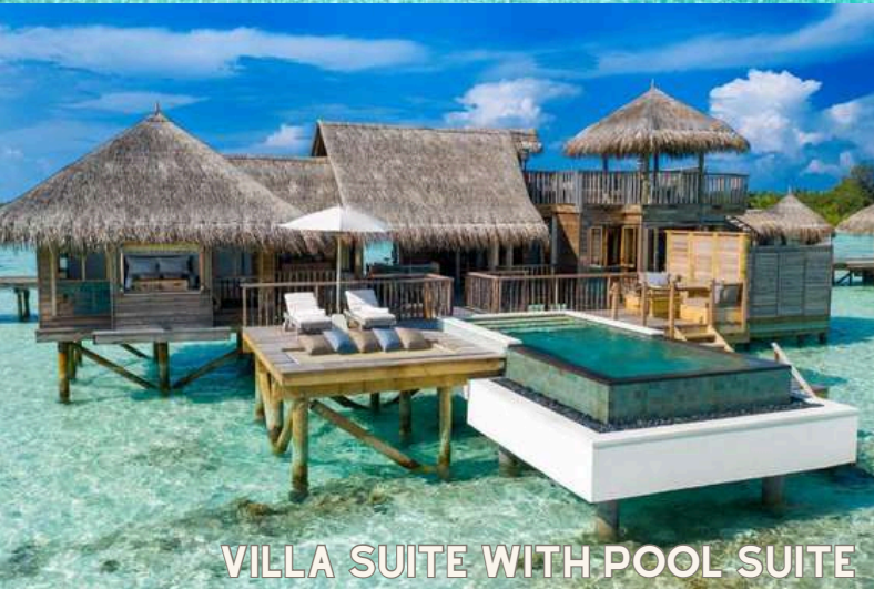
VILLA SUITE WITH POOL SUITE