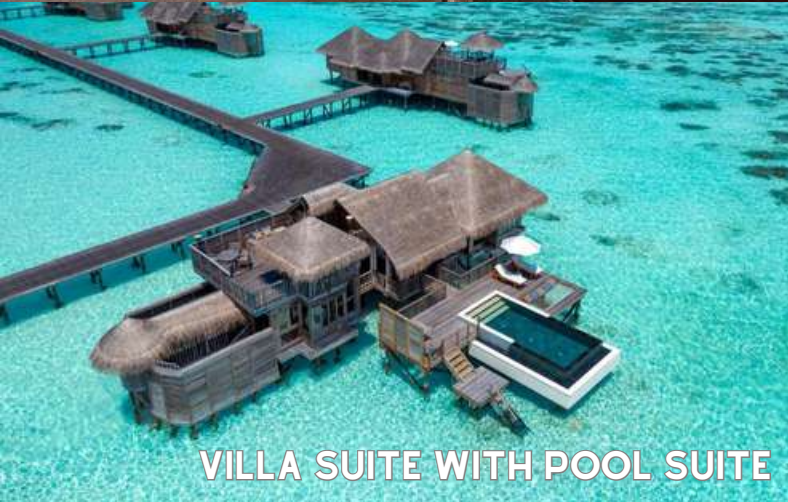
VILLA SUITE WITH POOL SUITE