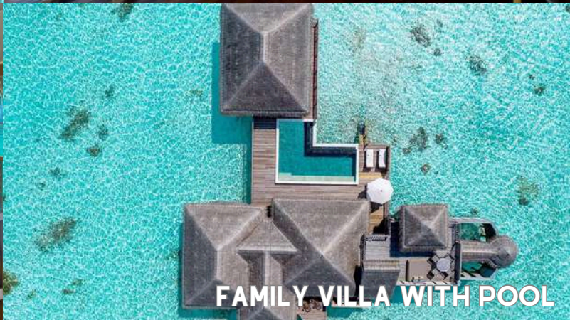
FAMILY VILLA WITH POOL