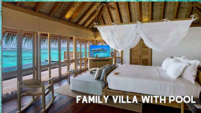
FAMILY VILLA WITH POOL