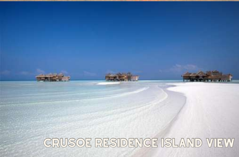
CRUSOE RESIDENCE ISLAND VIEW