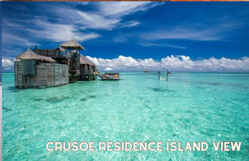
CRUSOE RESIDENCE ISLAND VIEW