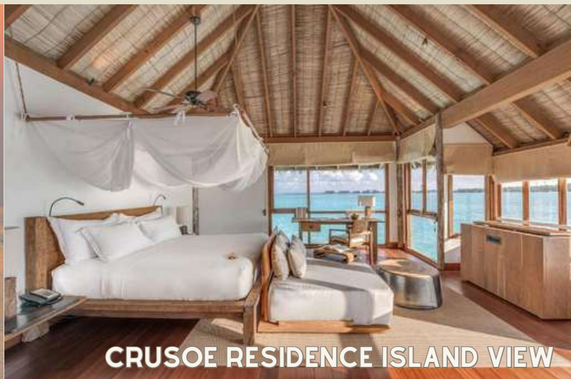
CRUSOE RESIDENCE ISLAND VIEW