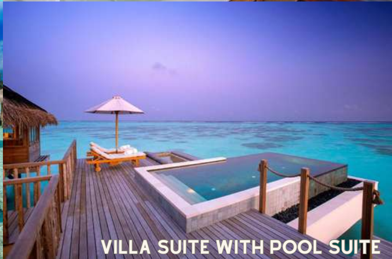
VILLA SUITE WITH POOL SUITE