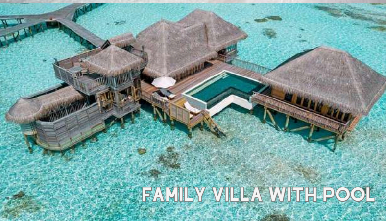
FAMILY VILLA WITH POOL