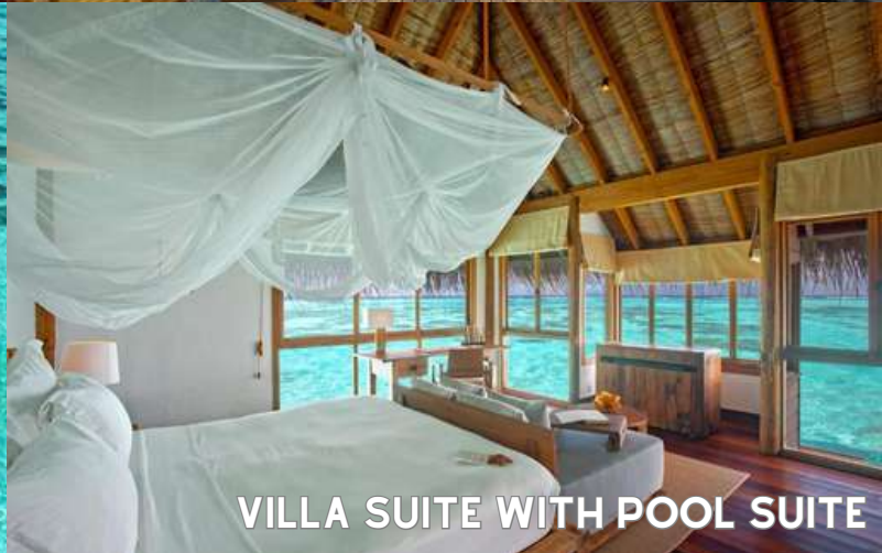
VILLA SUITE WITH POOL SUITE