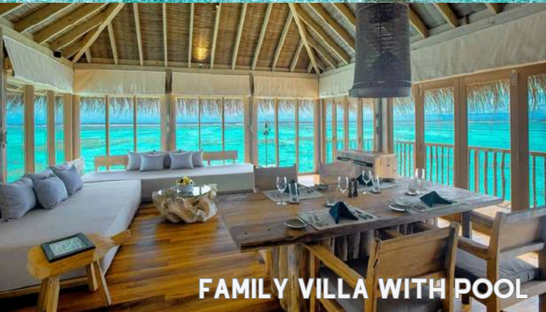
FAMILY VILLA WITH POOL