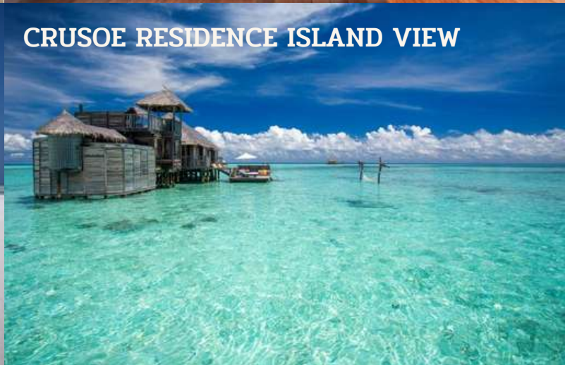
CRUSOE RESIDENCE ISLAND VIEW