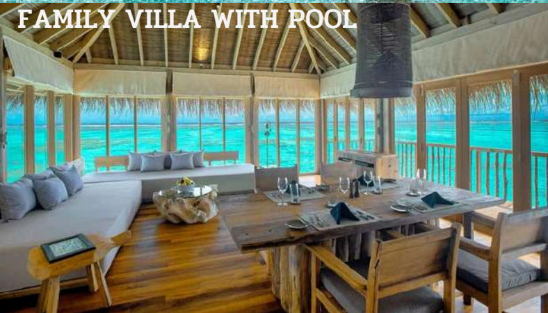
FAMILY VILLA WITH POOL