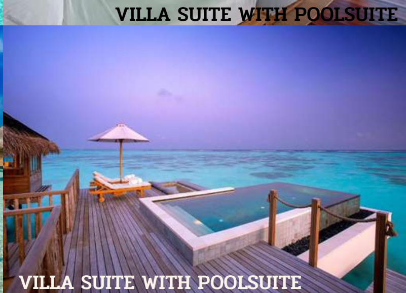
VILLA SUITE WITH POOL SUITE