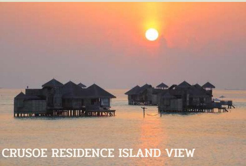
CRUSOE RESIDENCE ISLAND VIEW