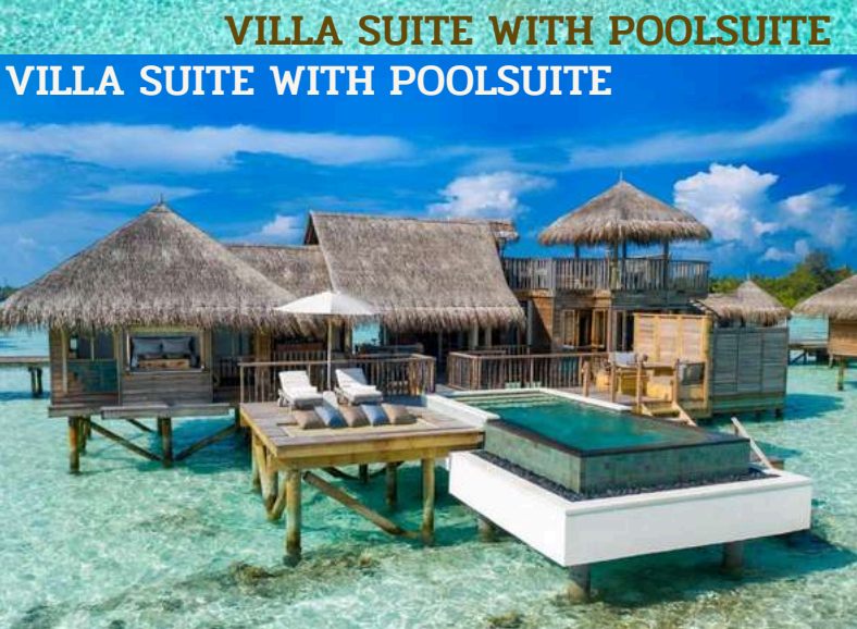
VILLA SUITE WITH POOL SUITE