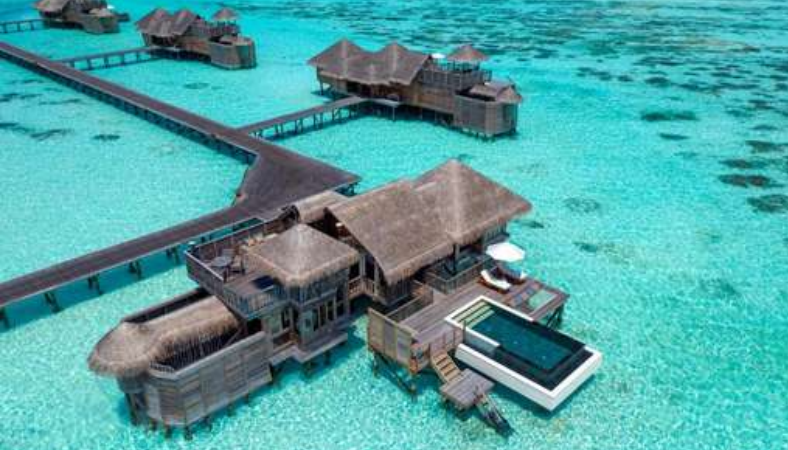
VILLA SUITE WITH POOL SUITE