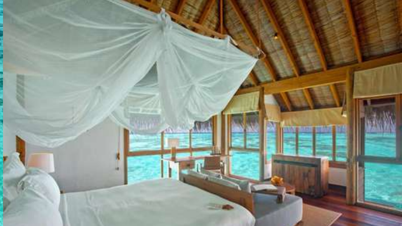
VILLA SUITE WITH POOL SUITE