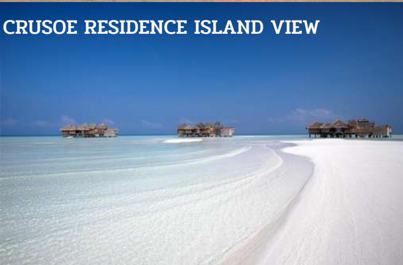
CRUSOE RESIDENCE ISLAND VIEW