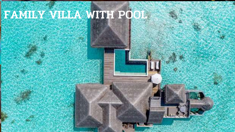
FAMILY VILLA WITH POOL