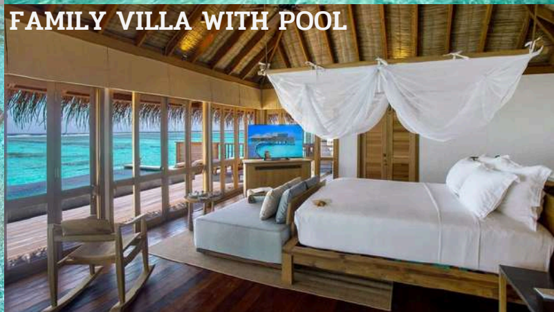
FAMILY VILLA WITH POOL