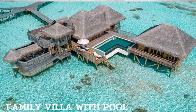
FAMILY VILLA WITH POOL FAMILY VILLA WITH POOL