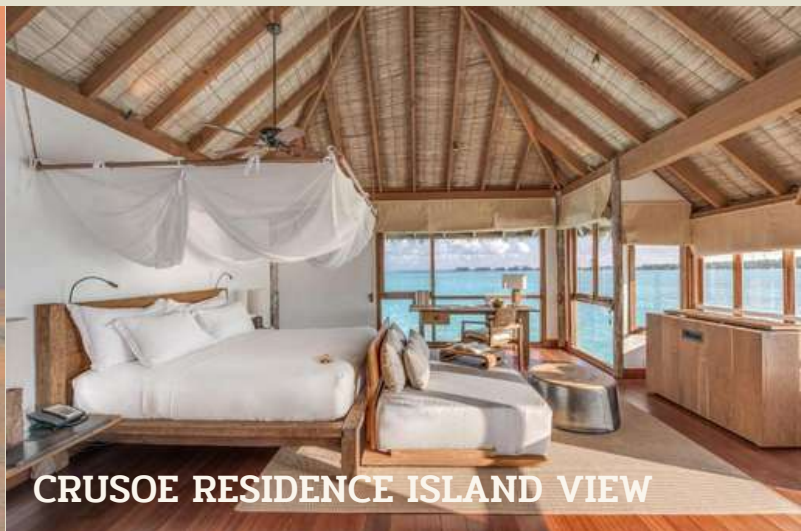
CRUSOE RESIDENCE ISLAND VIEW