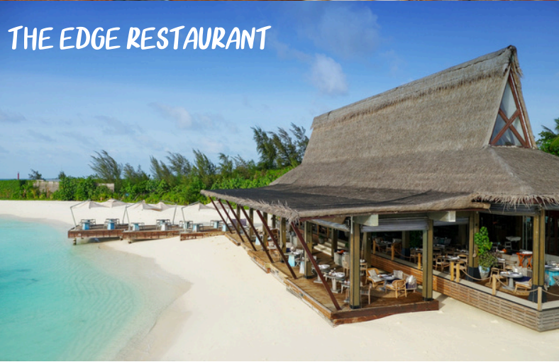
THE EDGE RESTAURANT