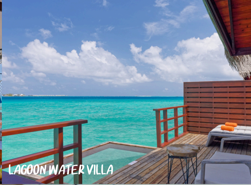
LAGOON WATER VILLA