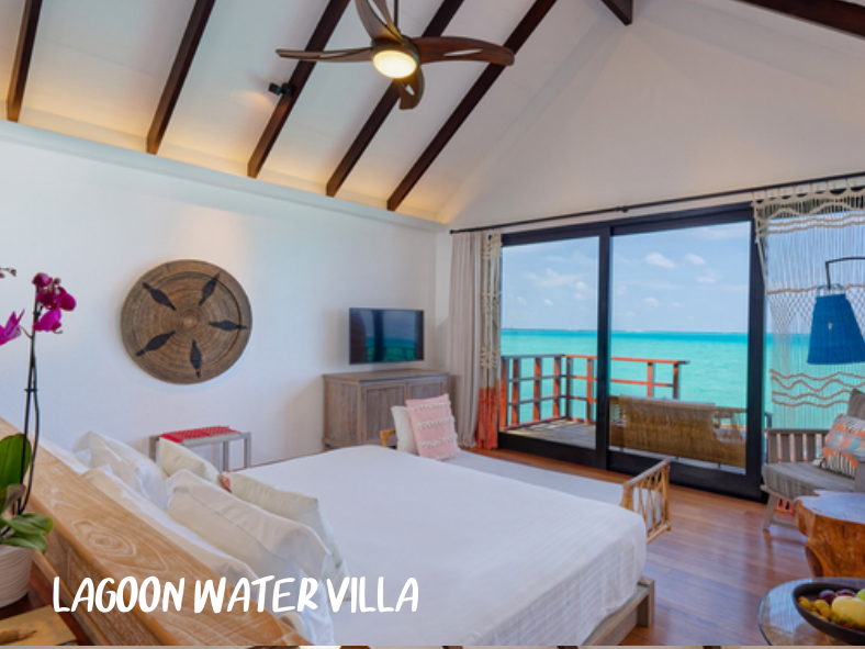
LAGOON WATER VILLA