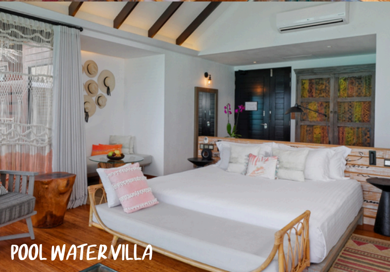
POOL WATER VILLA