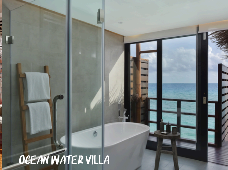
OCEAN WATER VILLA