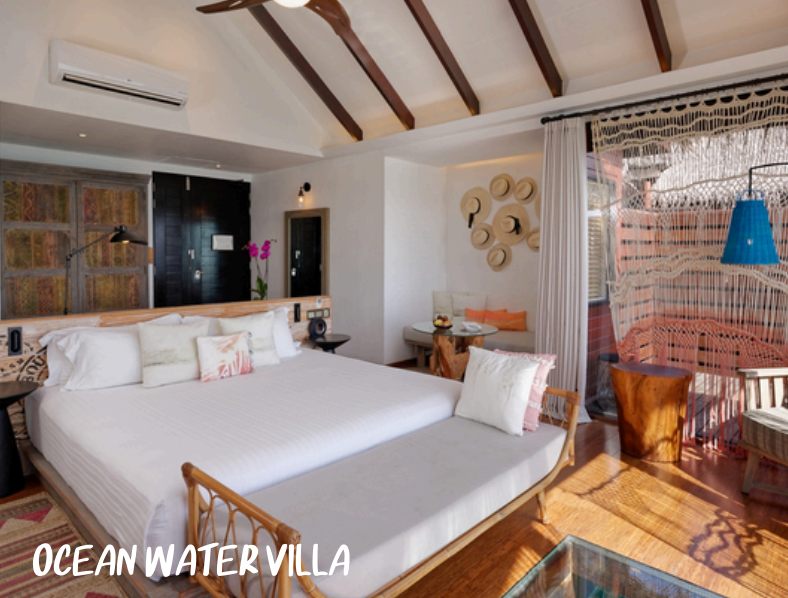
OCEAN WATER VILLA