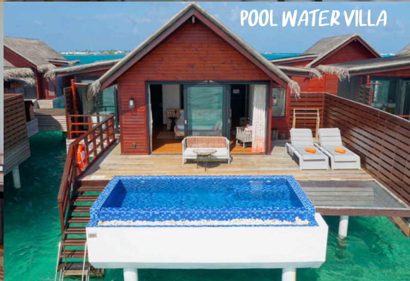
POOL WATER VILLA