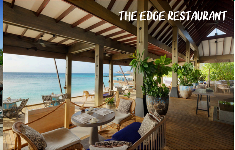
THE EDGE RESTAURANT