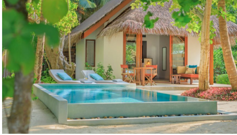
Deluxe Beach Villa with Pool