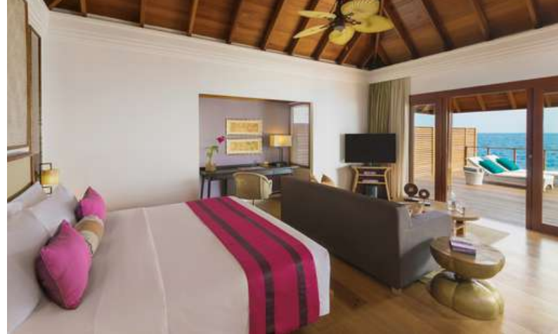
Water Villa with Pool