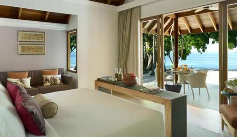
Deluxe Beach Villa with Pool