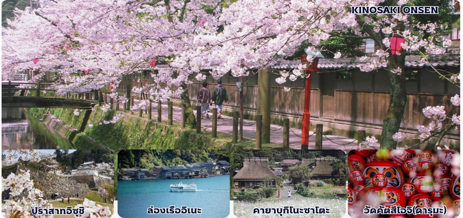
ปราสาทอิซุชิ