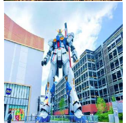
หุ่นกันดั้ม รุ่นใหม่ชื่อ RX93 FF Nu Gundam

📍 รับประทานอาหารกลางวัน ณ ภัตตาคาร เดินทางไปยัง ร้านค้า DUTY FREE ให้ท่านได้ซื้อของ อาทิ เครื่องสำอาง เซรั่ม โฟมล้างหน้า ยา คอลลาเจน และอาหาร ฯลฯ ... จากนั้นต่อไปยัง ฟูกูโอกะ แวะแชะรูปกับหุ่นกันดั้มยักษ์ตัวใหม่ล่าสุด (เม.ย. 22) ณ ห้าง LaLaport มีขนาดใหญ่กว่า Unicorn Gundam ที่โตเกียวและใหญ่กว่า RX93 FF Gundam ที่ Gundam Factory Yokohama เรียกได้ว่าเป็นแลนด์มาร์คสำคัญของเมืองฟูกูโอกะในปัจจุบัน (หากมีเวลาพอ) ... จากนั้นอิสระให้ท่านช้อปปิ้ง ย่านเทนจิน (Tenjin) หรือ ย่านฮากาตะ (Hakata) เป็นย่านช้อปปิ้งขนาดใหญ่ใจกลางเมือง รวบรวมแหล่งบันเทิง