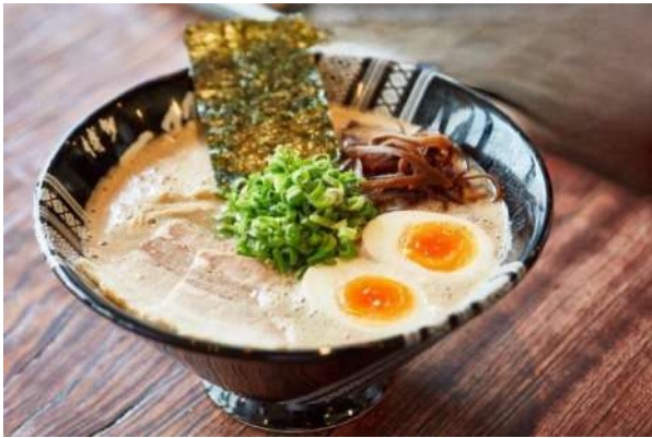
ฮากาตะราเมง (Hakata Ramen)