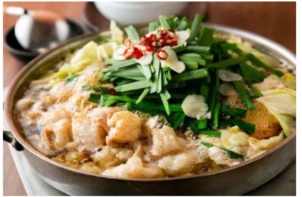
มตสึนาเบะ (Motsunabe)