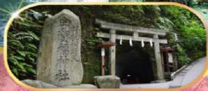
ZENIARAI BENTEN SHRINE