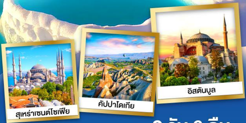
สุหระาชนดโซเฟีย