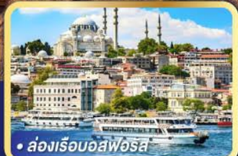
• ส่องเรือบอสฟอรัส