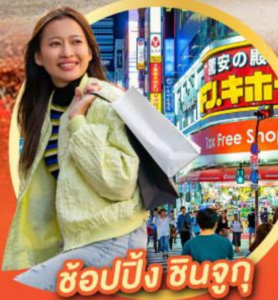
ช้อปปิ้ง ซินจุกุ