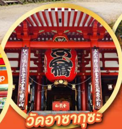
วัดอาซากุซะ