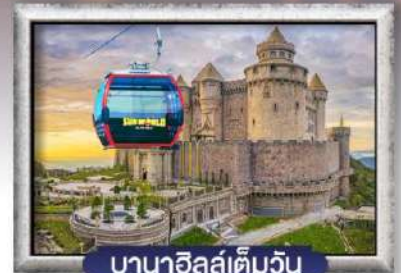
บาน่าฮิลล์เต็มวัน