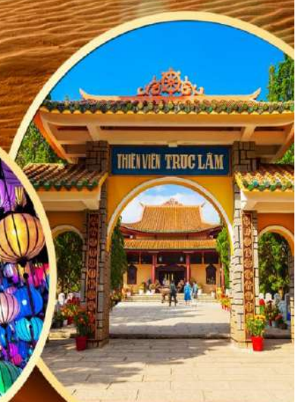
วัดตักลับ