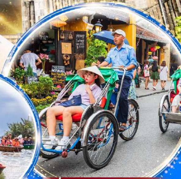
นั่งรถสามล้อฮิโกล์

พักบน บานาฮิลล์ 1 คืน นั่งกระเช้าที่ยาวที่สุดในโลก ขึ้นสู่บานาฮิลล์ ชมเมือง ฮอยอัน เมืองมรดกโลกที่สวยงามและเจียบสงบ พิเศษ!! บุฟเฟ่ต์นานาชาติ บานาฮิลล์