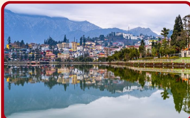
ทะเลสาบซาปา ทะเลสาบกลางเมืองซาปา