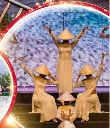
Charming Danang Show