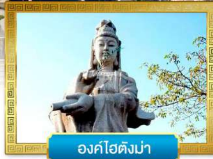
องค์ไฮตังม่า