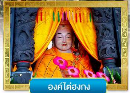
องค์ไต๋องกง