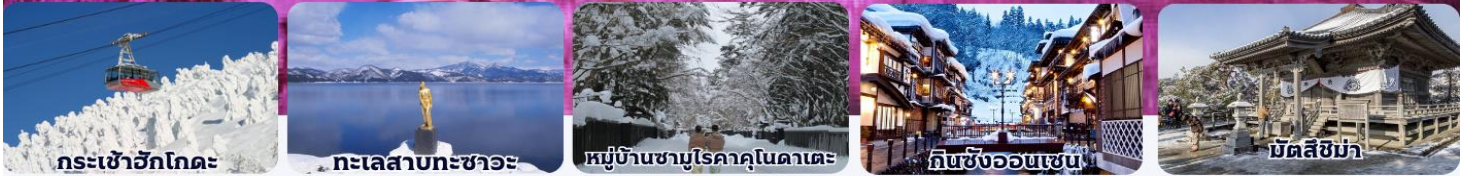
กระเช้าอิกโกดะ