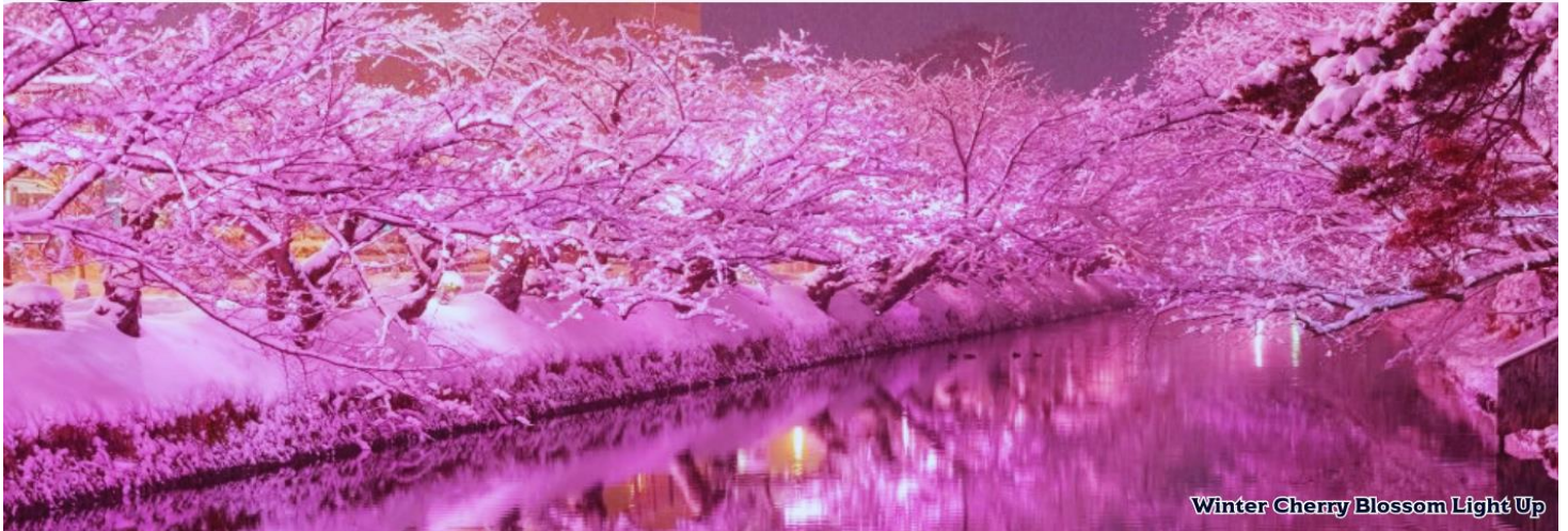
Winter Cherry Blossom Light Up