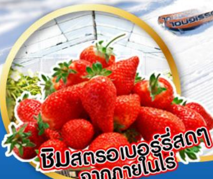
ชิมสตรอเบอร์รี่สดๆ จากภายในไร่