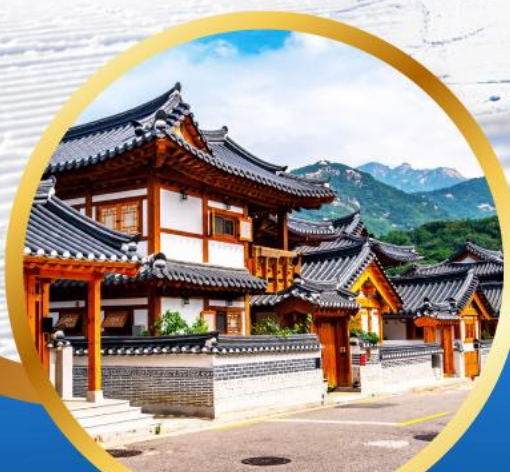
หมู่บ้านโบราณอันสวยงาม