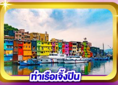
ท่าเรือเจิ้งปิ่น