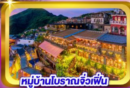
หมู่บ้านโบราณจิวเฟิ่น