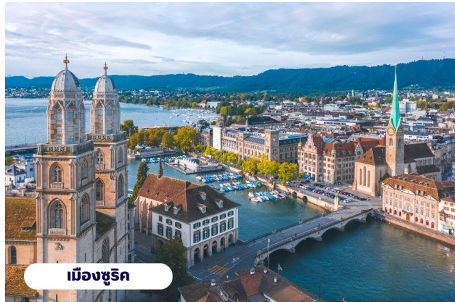
เมืองซูริก

ศูนย์กลางของการค้าสัตว์ที่สำคัญของเมืองซูริก ปัจจุบันจัตุรัสนี้ได้กลายเป็นชุมทางรถรางที่สำคัญของเมืองและยังเป็นศูนย์กลางการค้าของย่านธุรกิจ ธนาคาร สถาบันการเงินที่ใหญ่ที่สุดในประเทศ สวิตเซอร์แลนด์ นำท่านแวะถ่ายรูปกับ โบสถ์ฟรอมุนสเตอร์ (Fraumunster Abbey) จากบนสะพานมุนสเตอร์บรุค เป็นโบสถ์ที่มีชื่อเสียงของเมืองซูริก สร้างขึ้นในปี ค.ศ. 853 โดยกษัตริย์เยอรมันหลุยส์ ใช้เป็นสำนักแม่ชีที่มีกลุ่มหญิงสาวชนชั้นสูงจากทางตอนใต้ของเยอรมันอาศัยอยู่ นำท่านสู่ ถนนบาร์ทน์โฮฟชตราสเซอ (Bahnhofstrasse) เป็นถนนอันลือชื่อที่มีความยาวประมาณ 1.4 กิโลเมตร เป็นถนนที่เป็นที่รู้จักในระดับนานาชาติ ว่าเป็นถนนช้อปปิ้งที่มีสินค้าราคาแพงที่สุดแห่งหนึ่งของโลก ตลอดสองข้างทางล้วนแล้วแต่เป็นที่ตั้งของห้างสรรพสินค้า ร้านค้าอัญมณี ร้านเครื่องประดับ ร้านนาฬิกาและโรงแรมระดับหรู อิสระให้ท่านเดินเล่นและเลือกซื้อสินค้าตามอัชฌาศัย ได้เวลาอันสมควรนำท่านสู่สนามบิน