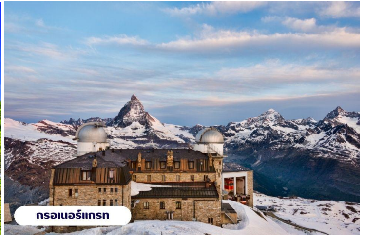
กรอเนอร์แกรน