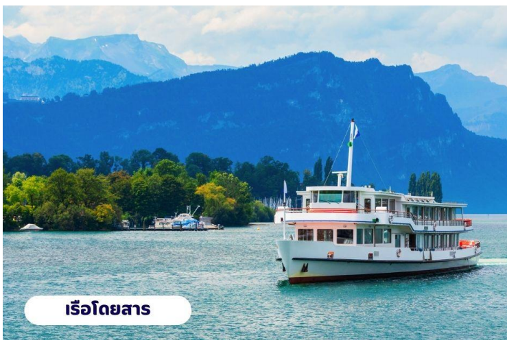
เรือโดยสาร

📍 บริการอาหารเช้า ณ ห้องอาหารของโรงแรม จากนั้นนำท่านเดินทางสู่ ยอดเขาริกิ (Rigi Kulm) โดยใช้การเดินทางโดยเรือจากทะเลสาบลูเซิร์นไปยังท่าเรือวิทซ์เนา (Vitzanu) จากนั้นนั่งรถไฟไต่เขา Rigi ถือได้ว่าเป็นรถไฟไต่เขาที่เก่าแก่ที่สุดในยุโรป และยังเป็นอันดับ 2 รองจากยอดเขาวอชิงตัน ในมลรัฐนิวแฮมป์เชียร์ สหรัฐอเมริกา ความสูงจากระดับน้ำทะเล 1,797 เมตร จนมาถึงยอดเขาริกิ (Rigi Kulm) ชื่อนี้มีที่มาจากคำว่า Mons Regina แปลได้ว่าราชินีแห่งภูเขา เพราะสามารถมองเห็นทิวทัศน์ของยอดเขาอื่นๆ ได้รอบ 360 องศา ชมวิวแบบพาโนรามาโอบล้อมด้วยธรรมชาติของทะเลสาบ Luzern และ Zug อีสระทุกท่านถ่ายรูปชมวิวดตามอัธยาศัย