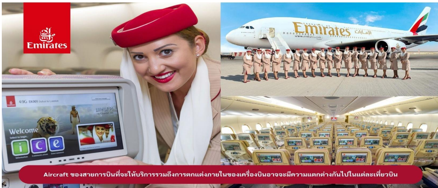
Aircraft ของสายการบินที่จะให้บริการรวมถึงการตกแต่งภายในของเครื่องบินอาจจะมีความแตกต่างกันไปในแต่ละเที่ยวบิน

วันที่สอง ดูไบ-เมืองบาร์เซโลน่า-มอนต์เซอร์รัต-ซากราดาฟามีเลีย