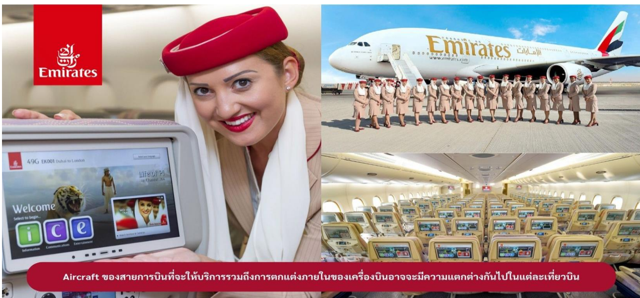
Aircraft ของสายการบินที่จะให้บริการรวมถึงการตกแต่งภายในของเครื่องบินอาจมีความแตกต่างกันไปในแต่ละเที่ยวบิน

21.00 น. ออกเดินทางสู่ เมืองดูไบ ประเทศสหรัฐอาหรับเอมิเรตส์ โดยสายการบินเอมิเรตส์ เที่ยวบินที่ EK373 (🍽️ บริการอาหารและเครื่องดื่มบนเครื่องบิน)