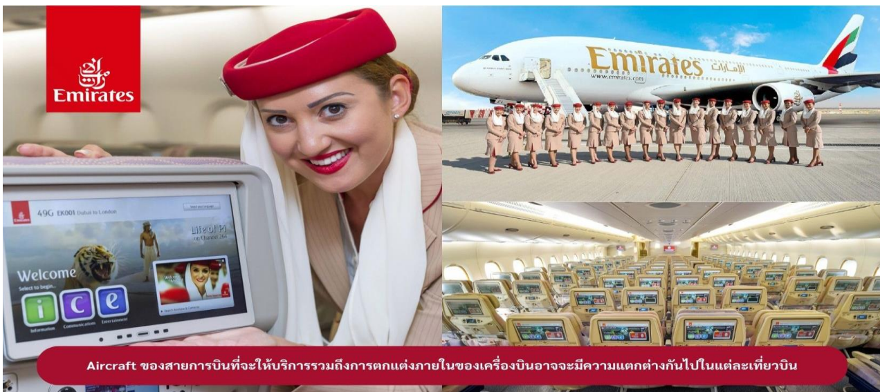
Aircraft ของสายการบินที่จะให้บริการรวมถึงการตกแต่งภายในของเครื่องบินอาจจะมีความแตกต่างกันไปในแต่ละเที่ยวบิน

22.00 น. !!!! ขณะเดินทางพร้อมกัน ณ สนามบินสุวรรณภูมิ อาคารผู้โดยสารขาออกระหว่างประเทศ ชั้น 4 ประตู 9 แถว T สายการบินเอมิเรตส์ แอร์ไลน์ (EK) เจ้าหน้าที่ให้การ