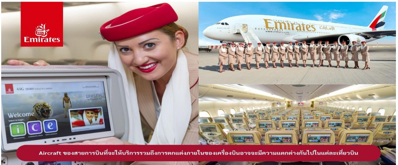
Aircraft ของสายการบินที่จะให้บริการรวมถึงการตกแต่งภายในของเครื่องบินอาจจะมีความแตกต่างกันไปในแต่ละเที่ยวบิน

23.00 น. 🛫 ขณะเดินทางพร้อมกัน ณ สนามบินสุวรรณภูมิ อาคารผู้โดยสารขาออกระหว่างประเทศ ชั้น 4 ประตู 9 แถว T สายการบินเอมิเรตส์ แอร์ไลน์ (EK) เจ้าหน้าที่ให้การต้อนรับและอำนวยความสะดวก