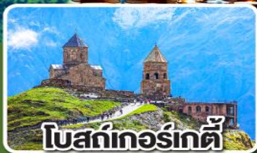
โบสถ์เกอร์เกตี