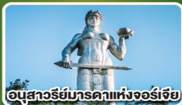
อนุสาวรีย์มารดาแห่งจอร์เจีย