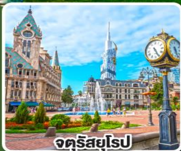
จัตุรัสยุโรป

การ์นตี พักโรงแรม Rooms วิวเทือกเขาที่สวยงามอลังการ