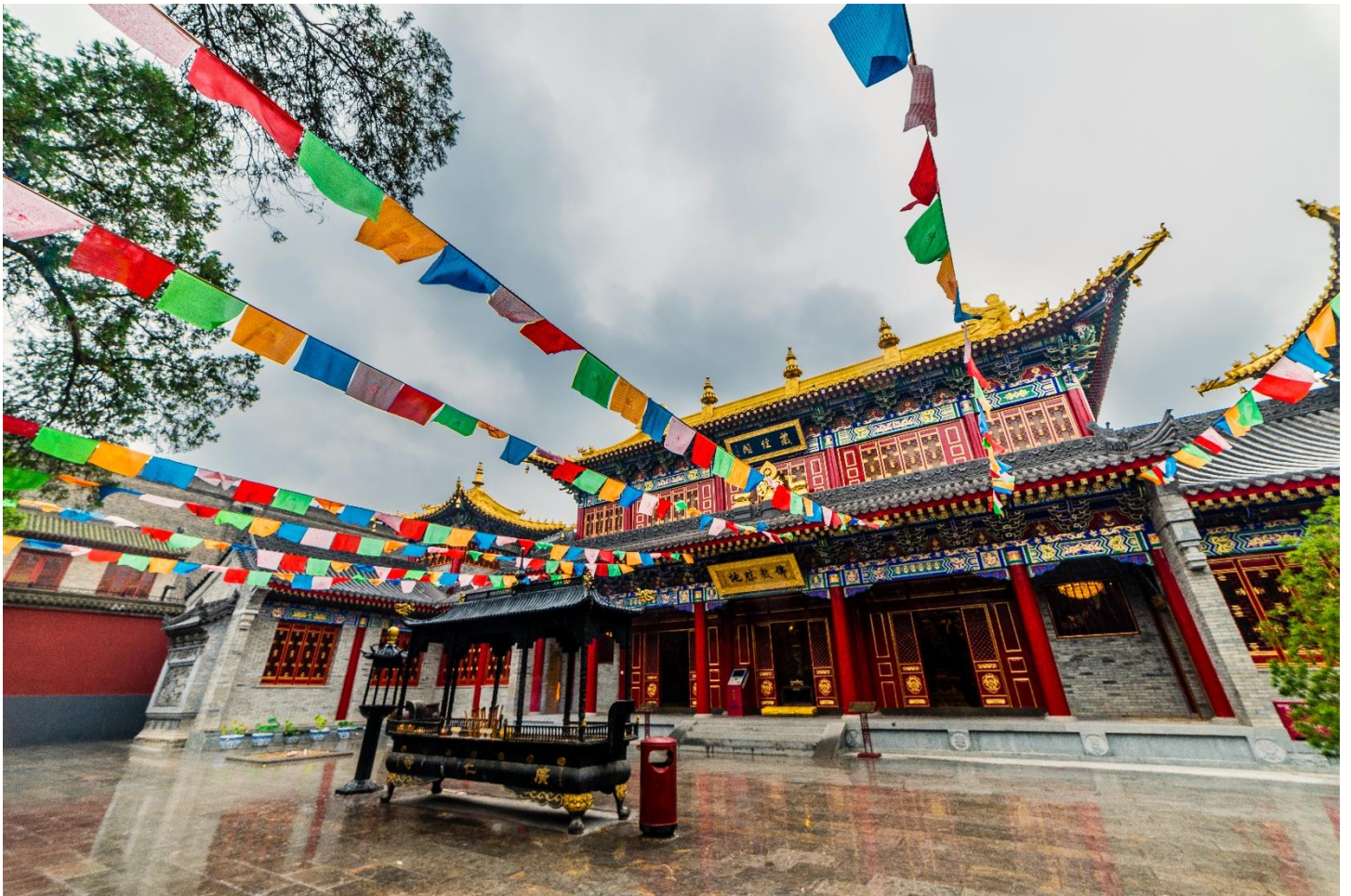
T2G-LYA01UQ ซื่ออัน ลั่วหยาง ถ้ำหลงเหมิน วัดเส้าหลิน สุสานจีนซี 6D 4N (UQ)

นำท่านเดินทางสู่ กำแพงเมืองโบราณ ได้ถูกสร้างขึ้น อันเกิดแนวคิดจากการกักตุนอาหาร และการสร้างเกราะ กำลังที่แข็งแกร่งของกองทัพ ในสมัยราชวงศ์หมิง โดย จู หยวน ฉาง ฮ่องเต๋องค์แรกของราชวงศ์ หมิง กำแพงเมือง แห่งนี้ เป็นกำแพงเมืองที่ความสมบูรณ์ที่สุดในประเทศ จีน และยังเป็นระบบป้องกันกองทัพโบราณที่ใหญ่ที่สุดในโลกอีกด้วย