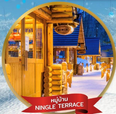
หมู่บ้าน NINGLE TERRACE