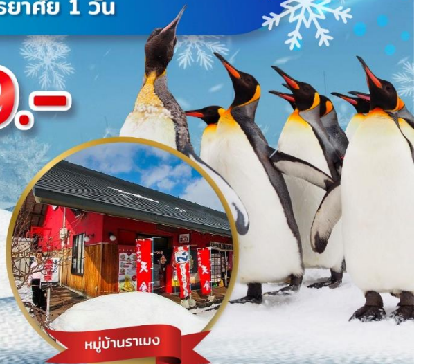
หมู่บ้านรามเอน