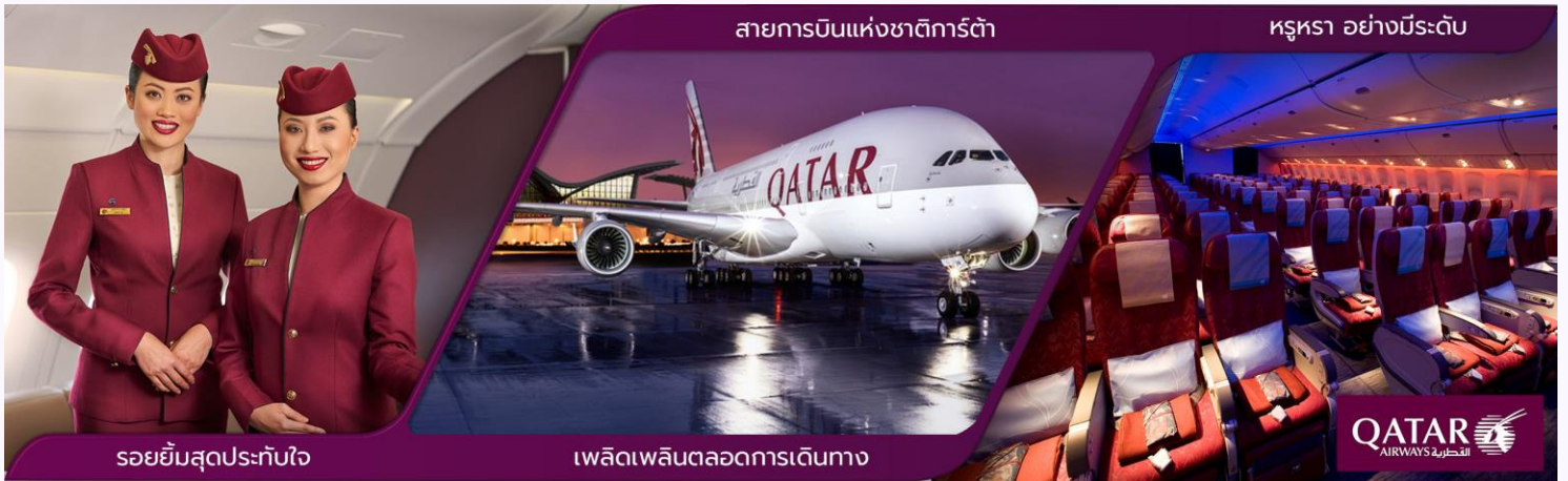
สายการบินแห่งชาติกาตาร์

02.30 น. ✈️ ออกเดินทางสู่ สนามบินท่าอากาศยานนานาชาติโดฮา ประเทศกาตาร์ โดยสายการบินการ์ต้าแอร์เวย์ เที่ยวบินที่ QR837 (บริการอาหารและเครื่องดื่มบนเครื่อง)